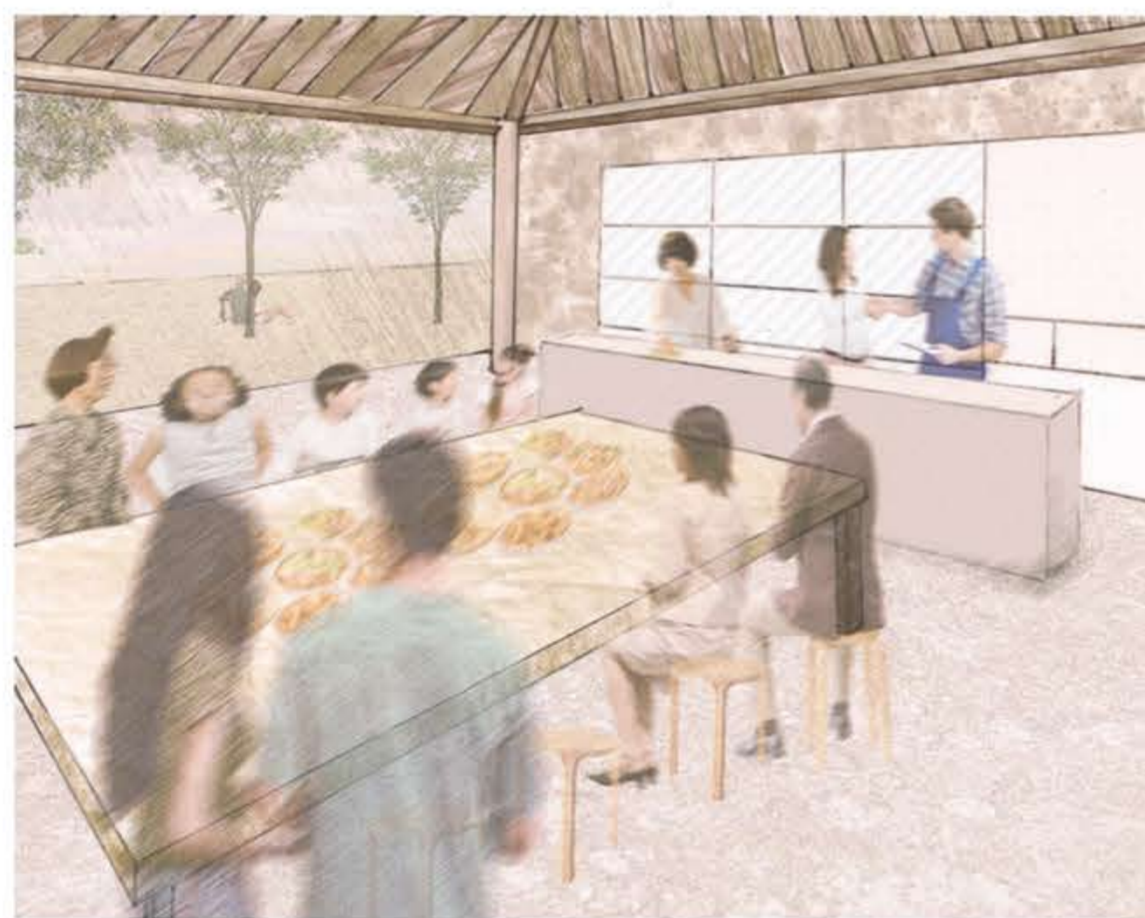
共同のキッチン&ダイニング。近所の人と食卓を囲む。今日あった出来事をみんなで振り返れる和やかな場となる。