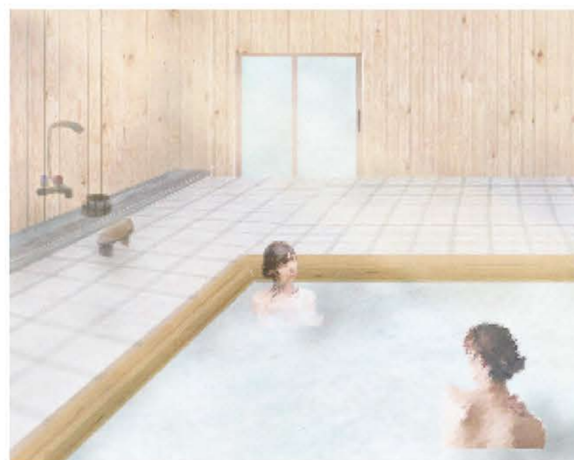
共同の大浴場。普段の生活とは少し異なり、さらに親密な関係をつくりだす。落ち着いた感情から生まれる会話で賑わう。