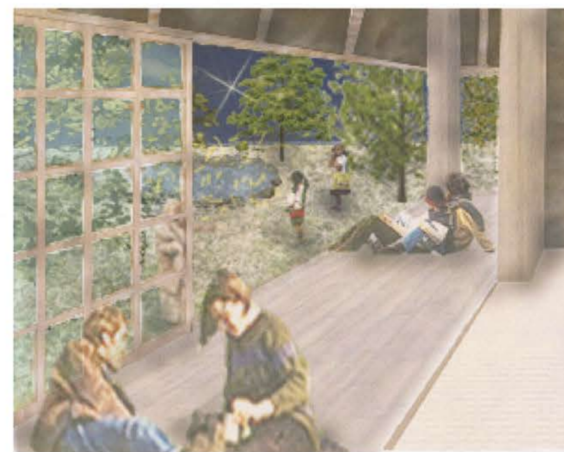
縁側からこぼれる光にあつまり、縁側が近所のヒトと共有する空間となる。近所のヒトとの団欒の場となる。