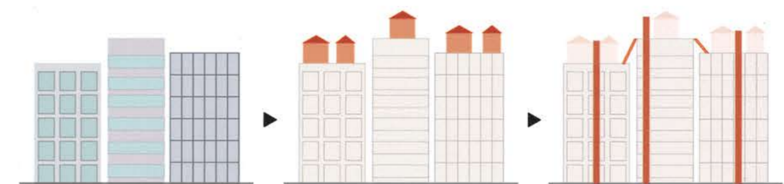
密集した都市のビル群。利便性はあるが、のびのびとした空地がない。 ビル群の屋上に住宅の新たなGLとして住宅群を計画する。 ビルのEVで地上と結ばれ都市の利便性を獲得。近隣のビル同士は橋や階段によって結ばれる。

密集された都市の体系に対し、住宅の新たなGLとして商業ビル群の屋上に住宅群を計画する。近隣のビルとビルは階段や橋で結ばれ、住宅が広がり、都市の街区ごとに地域体を形成する。商業と住宅がエレベータによってつながることで、都市の利便性と直結し、最大限都市を住みつくす。