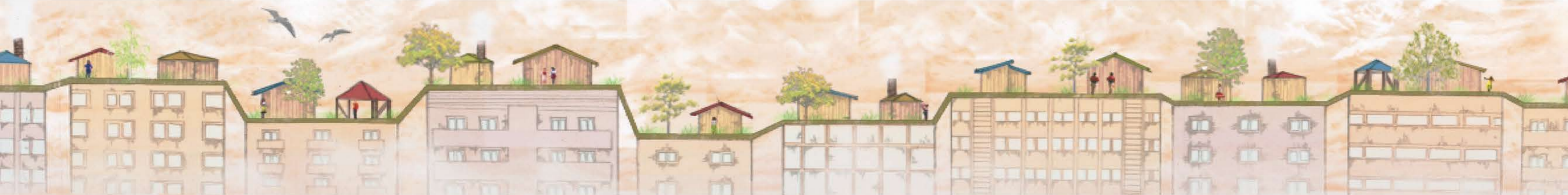
地上では人が密集し、新たなGLでは住宅が散在する。モノにあふれた地上に対し、自然にあふれ、ヒトとヒトがつながり生活をする社会がつけられている。