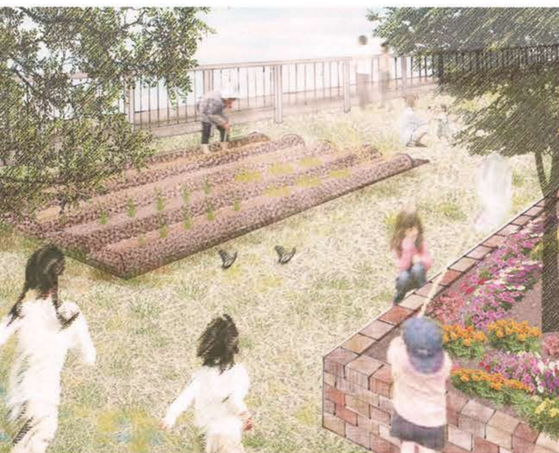
生態系が混じり合い、虫採りをする、植物を育てること、自然の中で体験が快楽をうむ。のびのびとした環境がヒトとヒトを近づける。