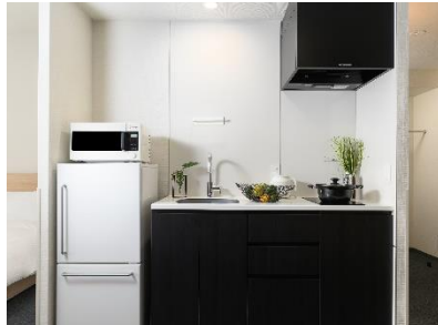
電子レンジ・食器・調理器具のあるキッチン