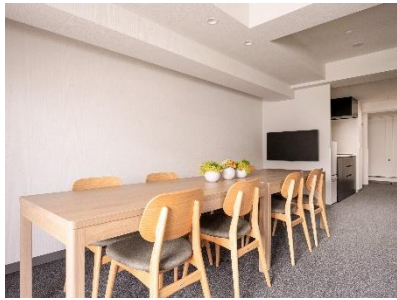
みんなで一緒に食事ができるダイニング（8名・6名）

※. 2022年11月時点の予定。料金は客室・時期により異なります。詳細はMIMARU公式サイトをご覧ください。