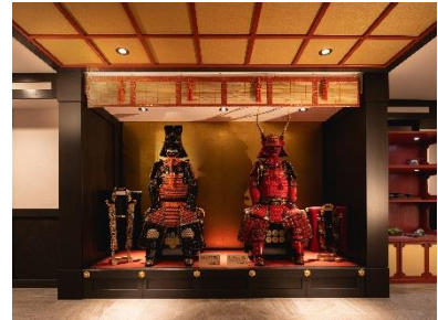
甲冑ディスプレイ