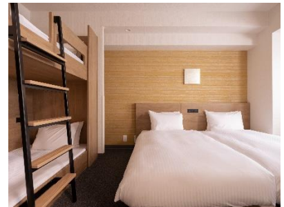
子どもが喜ぶバンクベッド