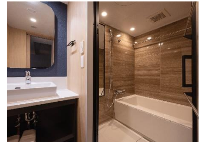
洗い場と湯船のあるバスルーム