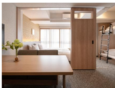
広いリビング・ダイニング