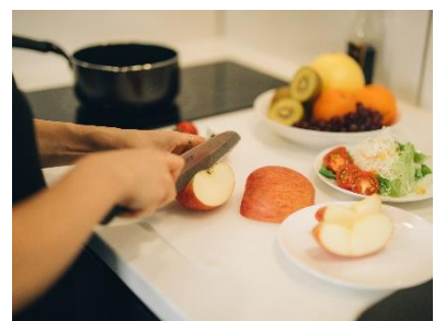
調理器具の揃ったキッチン