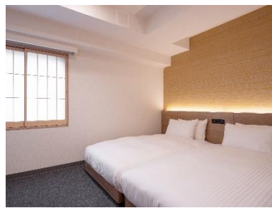
独立したベッドルーム