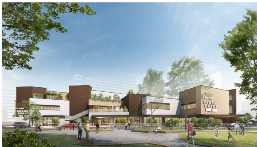
「フレスポ阿波座」完成予想パース※イメージであり実際とは異なる場合があります。

※CASBEE(建築環境総合性能評価システム)は、省エネや環境負荷の少ない資機材の使用といった環境配慮や、室内の快適性や景観への配慮なども含めた建築物の品質を総合的に評価するシステム