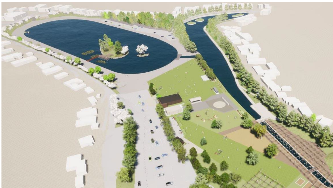
完成予想パース ※イメージであり実際とは異なる場合があります。