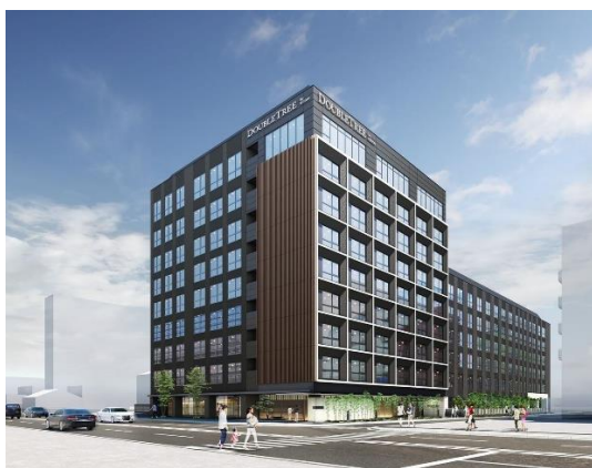
ホテル外観(イメージ)