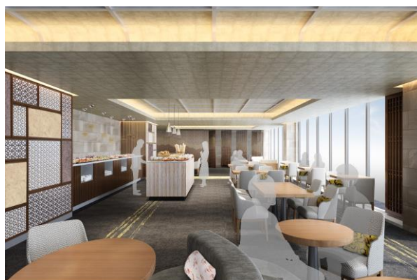
エグゼクティブラウンジ