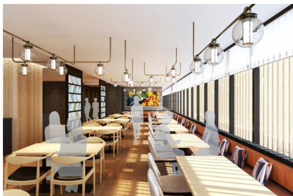
オールデイダイニング