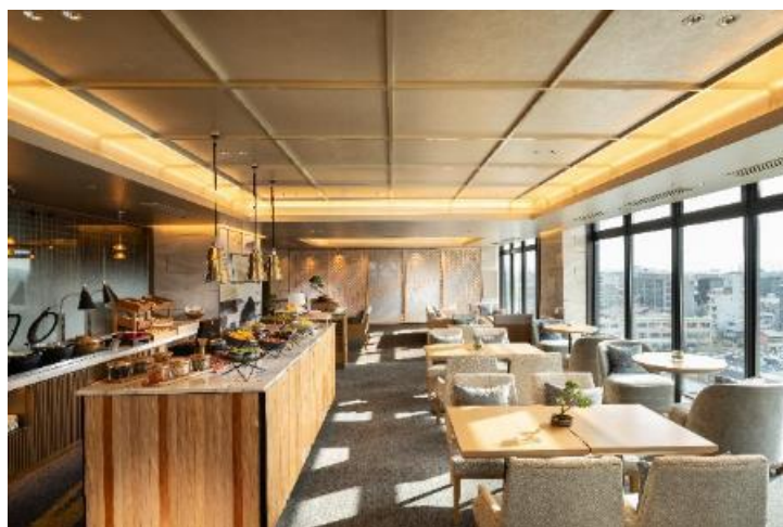
エグゼクティブラウンジ

日当たりの良い部屋からは新幹線の往来の眺めと一緒に北側の京都の街が一望できます。また、スイートルーム 3 室のうち 1 室は「畳スイートルーム」として、日本文化に興味があるお客様にご満足いただける和スタイルの客室をご用意しました。最上階 9 階に位置する、エグゼクティブルームおよびスイートルームにご宿泊のお客様のみがご利用いただけるエグゼクティブラウンジでは、チェックイン、チェックアウト、朝食、リフレッシュメント、イブニングカクテルなどのサービスをご提供いたします。