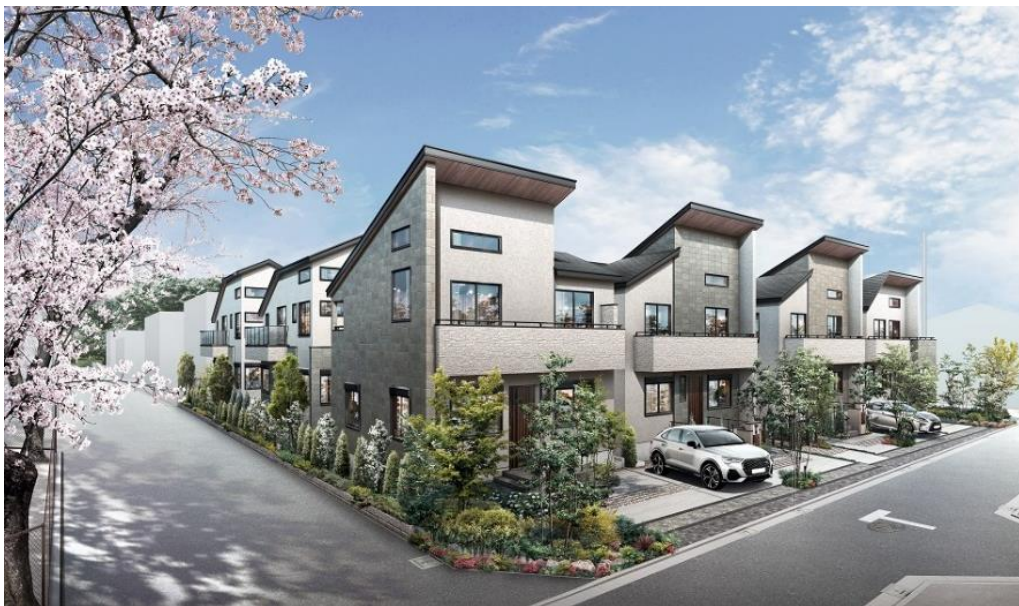
『イニシアフォーラム井の頭恩賜公園』街並み完成予想 CG