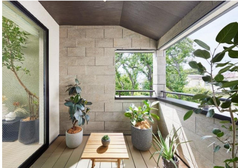
『イニシアフォーラム井の頭恩賜公園』10号棟インナーバルコニー

屋外とシームレスにつながる、借景を楽しみ、風と光に触れる、贅沢なプライベート空間。