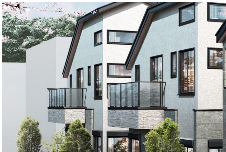
『イニシアフォーラム井の頭恩賜公園』街並み完成予想図

シャープなフォルムを彩る大判タイル、軒裏や玄関扉の木調素材。白をベースとしたカラーが光の移ろいや木陰を美しく映しだす、ナチュラルで上質な風合いのあるマテリアルを採用。