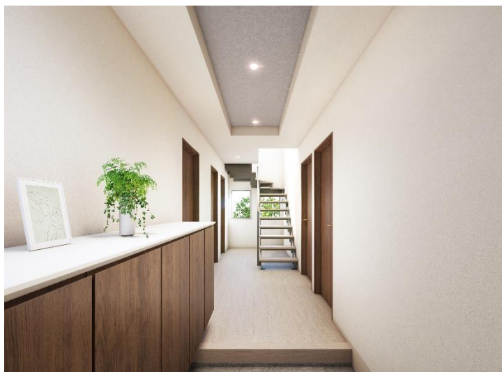
『イニシアフォーラム井の頭恩賜公園』 8号棟 玄関完成予想図

「井の頭恩賜公園」内を歩いて帰り着き、玄関を開けると奥の窓から緑が見える。上下階をつなぐ階段には、空間の広がり表現する鉄骨階段を採用（3・4・5号棟除く）。