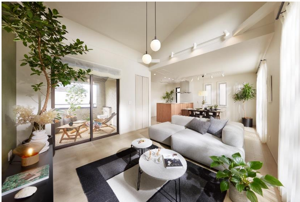
『イニシアフォーラム井の頭恩賜公園』 10号棟・ダイニング・キッチン・インナーバルコニー

大和ハウスグループの株式会社コスモイニシア（本社：東京都港区、社長：高智 亮大朗、HP： https://www.cigr.co.jp/ ）は、新築分譲一戸建『イニシアフォーラム井の頭恩賜公園』（東京都三鷹市、総区画数10区画）の第1期1次4区画（3・4・8・9号棟）について2024年9月21日から購入登録受付を開始しました。