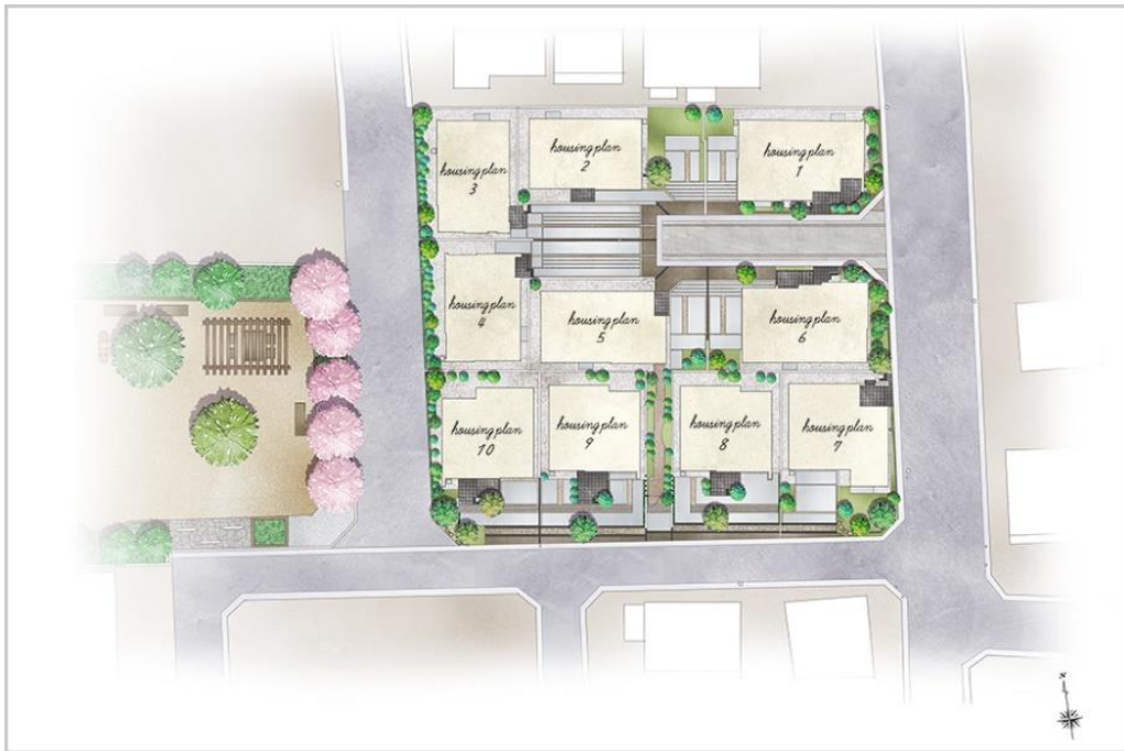
『イニシアフォーラム井の頭恩賜公園』全体区画イメージイラスト

街区の中央にはインターロッキング舗装の開発道路、ゆとりある棟間や連続させたカースペースを配し、開放的にしました。周囲の道路に面した部分には武蔵野に継がれてきた地域植生等の植栽を採用。開発道路沿いは無電柱化し、より開放感を高めた配棟です。