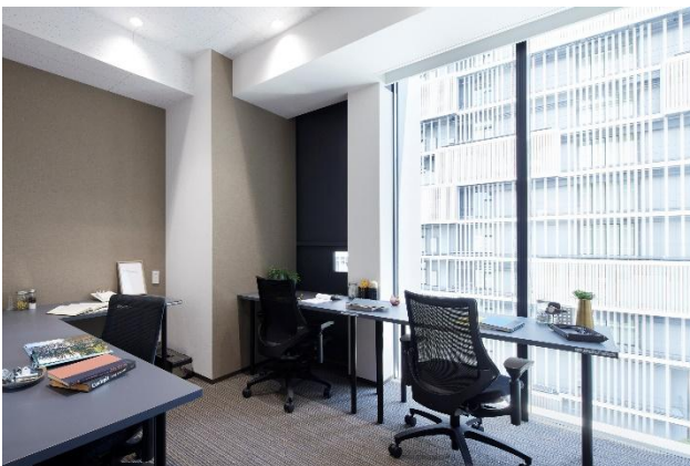
個室イメージ(当社他拠点写真)