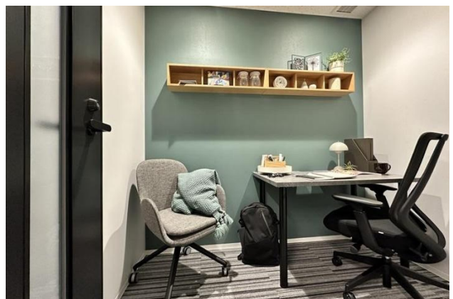
個室イメージ(当社他拠点写真)