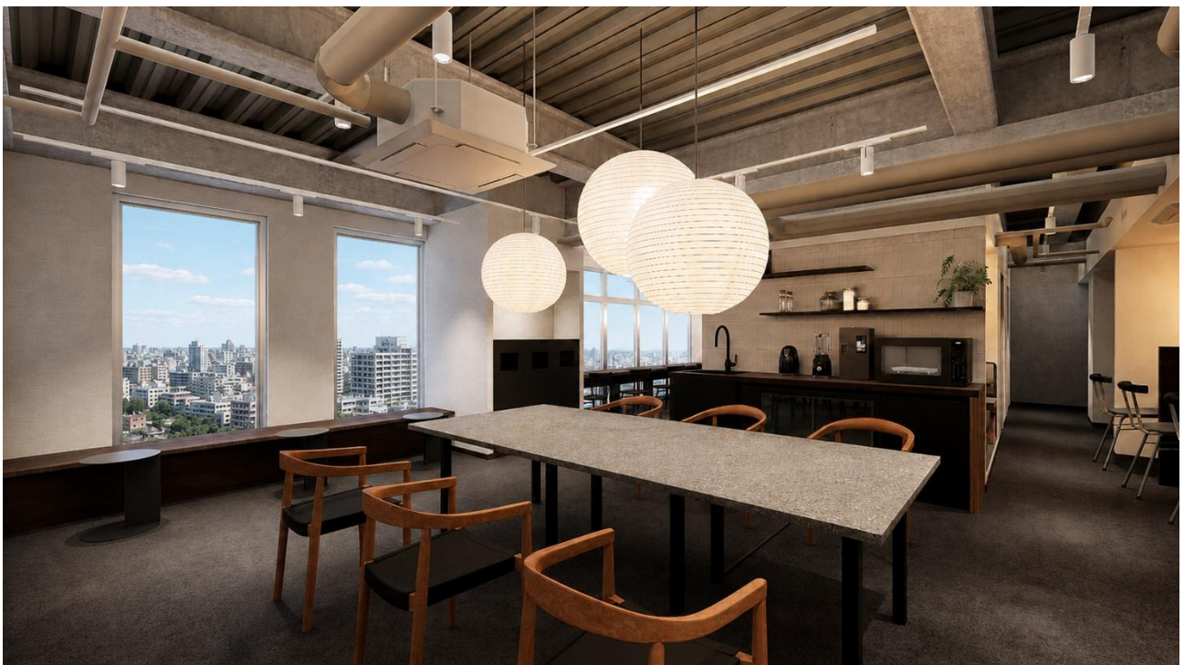
『MID POINT 両国』共用ラウンジ完成イメージ

本施設は、国技館をはじめ日本文化や伝統を感じられる街並みに位置し、“現代に落とし込まれた和”を空間コンセプトに設計したシェアオフィスです。土俵から着想を得たデザイン、陰影を美しく引き立てる照明、木素材を取り入れ、街の文脈と調和する空間を創出しました。また、複数人での利用だけでなく、「1人で快適に過ごす」ことにも着目。ソロワークや思考整理、リラックスなど、多様な利用シーンに対応する空間構成としています。