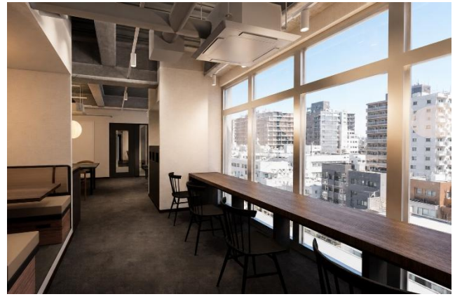
共用ラウンジ完成イメージ