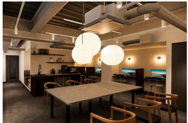
共用ラウンジ完成イメージ