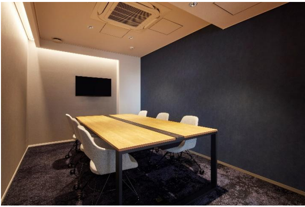
会議室イメージ(当社他拠点写真)