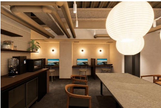
共用ラウンジ完成イメージ