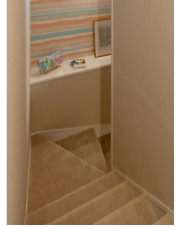
転倒時の衝撃をやわらげる素材