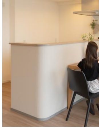
曲線を取り入れたデザイン