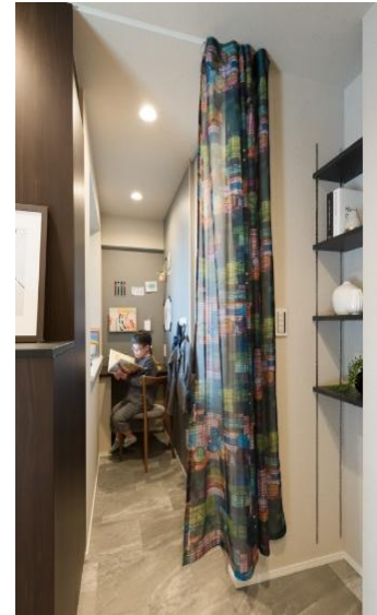
『シーズガーデン戸越公園』