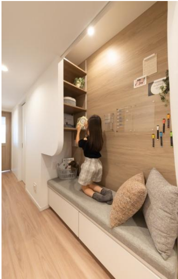
『イニシア練馬ブライトステージ』

https://www.cigr.co.jp/pj/chuko/detail/?p=MCY005101&frm=input