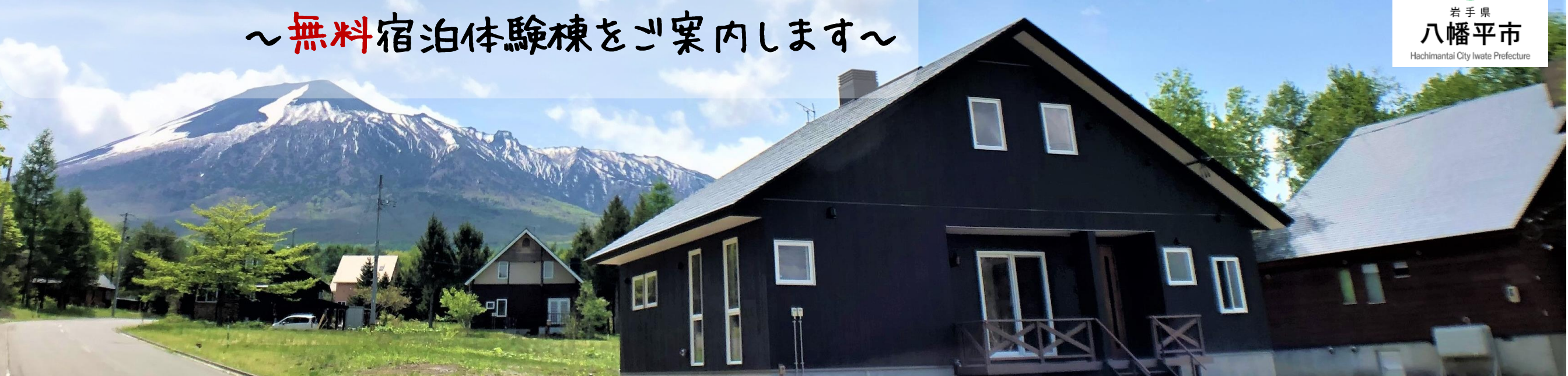
E街区99号地 令和2年6月撮影