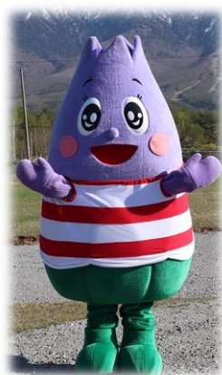
八幡平市りんどうの妖精 ありんちゃん