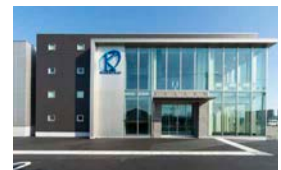
倉谷アルミ工作所(富山県)

P037 (商業・事業施設) ZEBセミナー開催によるZEBの理解促進と普及・拡大