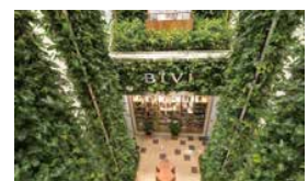
商業施設 BIVI 千里山(大阪府)

壁面緑化に活用できる薄型プランターの「D'sグリーンパレット」やオフィス空間を快適にする室内緑化「VERDENIA」(ヴェルデニア)の販売を推進しています。