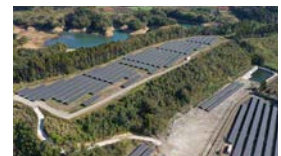
DREAM Solar 宮崎国富(宮崎県)

グループ全体で315カ所、426MW *1 の再生可能エネルギー発電所を運用しています(2021年3月末)。2020年度は、富山県や宮崎県などに大型の太陽光発電所など、新たに37カ所稼働させました。また、非化石証書を活用したCO 2 フリー電力の販売も大幅に拡大しました。今後はPPA *2 モデルなど新スキームにも注力します。 ※1 自家消費分を除く ※2 需要家と売電事業者が直接、電気の売買契約を結ぶこと。この契約により、需要家は特定の再生可能発電設備から指名買いができる