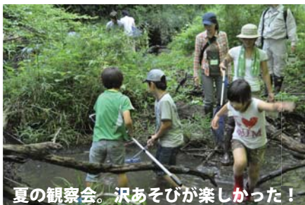
夏の観察会。沢あそびが楽しかった!