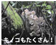
キノコもたくさん!