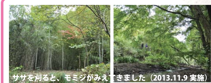
ササを刈ると、モミジがみえました (2013.11.9 実施)

ボランティア整備に参加して下さった皆さま、ご協力ありがとうございました。2014年度も、引き続き「自然ふれあい体験会」、「ボランティア整備」を実施してまいります。