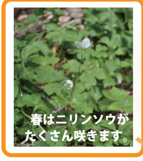
春はニンソウがたくさん咲きます。