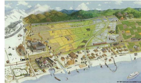
▲南比良ふるさと絵屏風

「ふるさと絵屏風」は、滋賀県立大学の上田洋平先生が開発した「心象図法」により描かれるものです。ある地域を対象とし、その地域の生活者一人一人の心に息づく思い出を聞きだし、地域で力を合わせて一枚の大きな絵屏風に集結させます。その土地の生業、祭、四季のうつろい等、生活のあらゆる場面が描かれます。完成した絵屏風は、絵の中にあるエピソードを子どもたちに語り伝え、ふるさとの思い出を未来へつなぐ教材となります。