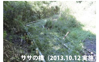
ササの橋 (2013.10.12 実施)