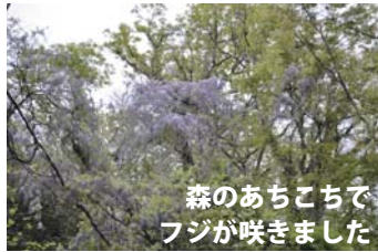
森のあちこちでフジが咲きました