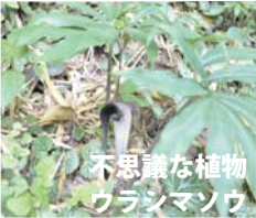
不思議な植物 ウランマンソウ