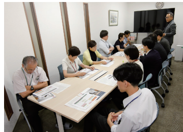
事務所研修会風景

普段からの営業推進統括部との関係性の中で、関与先の課題にふさわしい案件をスピーディーに提案し解決につながったこの事例は、多くのオーナーさまの課題に通じる事例となりました。