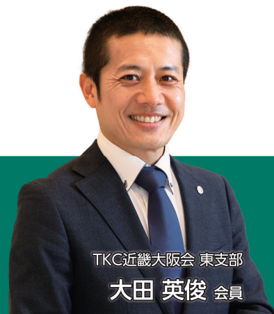
TKC近畿大阪会 東支部