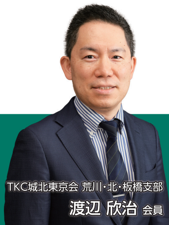
TKC城北東京会 荒川・北・板橋支部