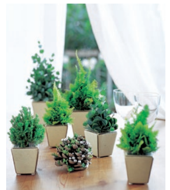
小さなツリーのアレンジメント。森のようにいくつか並べてもすてき。

コニファー（針葉樹の総称）にはさまざまな種類があり、鉢植えで育てられる種類もあります。円錐形に茂り、葉が明るいグリーンの「ゴールドクレスト」や銀白色の葉が美しい「ブルーアイス」が人気。一般的に寒さに強く、日当たりと水はけのよい環境を好みます。土が乾いたらたっぷりと水を与えましょう。クリスマスにはモールやオーナメントを飾ってドレスアップしましょう。