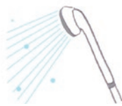
カビの栄養源になる皮脂や石けんなどの汚れはシャワーで洗い流す習慣に。

押し入れやクローゼットは詰め込み過ぎないようにして、通気性をよくしましょう。時々、開放して空気を入れ換えをします。衣類やふとんは、湿気を吸着しやすいので除湿剤も有効。しまつときは、体温の温もりや汗などの湿気が抜けてからにしましょう。