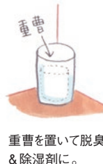
重曹を置いて脱臭&除湿剤に。

雨に濡れたり、汗を吸った靴をシューズボックスにそのまましまつと、湿気やニオイがこもりやすくなります。ひと晩置いて熱と湿気を取ってからしまします。定期的に中の靴を全て出して風を通し、その間、扉を開けてシューズボックス内の空気も入れ換えましょう。