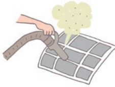
フィルターを取り外し、掃除機でホコリを吸い取る。ひどい汚れのときは水洗いをし、乾燥させて元通りセット。

エアコンのフィルターは空気中に含まれるホコリなどの汚れが付着し、蓄積すると目詰まりして、空気の取り込みを邪魔してしまいます。そうすると、フィルターがきれいな場合と比べ5〜10%のムダな電力を消費することになります。シーズン中は2週間に1回程度、お手入れをしましょう。