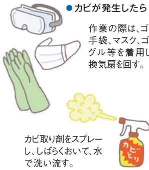
カビ取り剤をスプレーし、しばらく置いて、水で洗い流す。