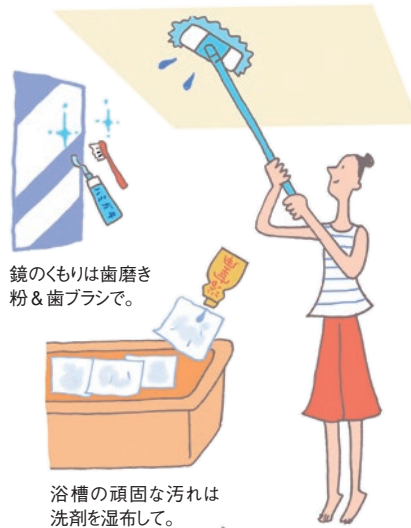
鏡のくもりは歯磨き粉&歯ブラシで。