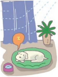
ペットのための留守中の冷房は、部屋の温度が上がらないよう日よけを。

エアコンで電力を多く使うのはスイッチを入れたり、温度設定を変えたとき。一定の温度で連続運転した方が電力がかからない場合も。センサー付きのエアコンでは、人のまわりが冷えたら、自動で風量などを調節し、効率よく快適な温度をキープしてくれます。