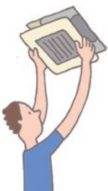
必ず電源を切ってから行う。

換気扇にホコリなどの汚れがたまっていると、しっかりと換気ができません。定期的にカバーを外し、取り除きましょう。また、浴室乾燥機はフィルターを取り外して、ホコリを掃除機で吸い取って、中性洗剤を使って水洗いし、よく乾かしてから取りつけます。